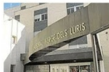
Auxiliar de clínica, 59 años, del hospital Virgen de los Lirios de Alcoy, Alicante.