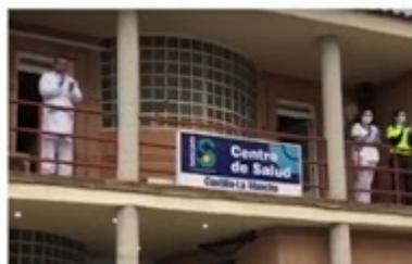
Carlos de Aragón, 65 años, médico del centro de salud de Yepes, Toledo.