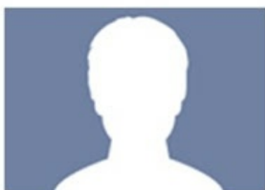
Anónimo. Farmacéutico comunitario en activo en Madrid.